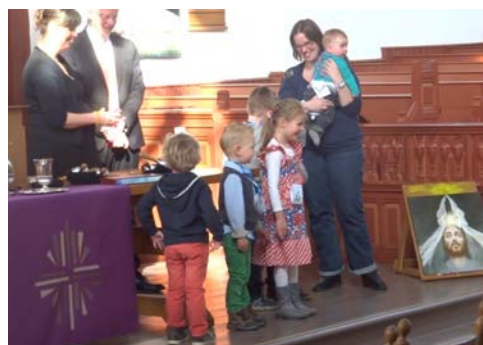
De kinderen van "Kom in de kring" laten horen en zien wat ze geleerd hebben

Op palmzondag vieren we de feestelijke intocht van Jezus in Jeruzalem welke extra kleur krijgt door de intocht van de kinderen uit onze gemeente met hun zelf versierde palmpaasstokken. De lijdensweg van Jezus voorafgaande aan Pasen is voor