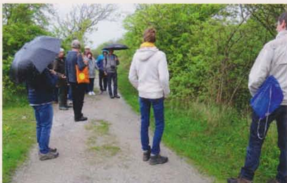
Zwanenwater wandeling in de regen