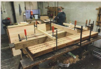
Orgelpijprevisie Van Dam-orgel