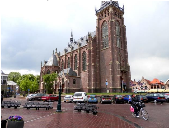
Grote Kerk op de Markt, Schagen