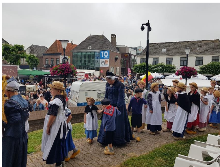
de kinderdansgroep op weg naar het podium