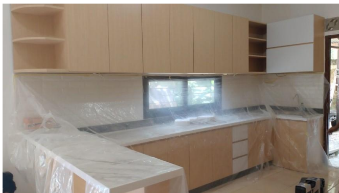
De keuken is klaar!

krijgen. Zonder paspoort zou hij binnen 4 dagen weer op het vliegtuig naar huis gezet zijn.