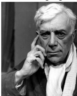
Georges Braque (Frans kunstenaar. 1882-1963)

En de veertigdagentijd komt er weer aan. Het is nu bijna een traditie dat we in die weken een inzameling doen voor de voedselbank. Wat u zoal daarvoor mee kunt nemen vindt u verderop in het blad. Als laatste wil ik u wijzen op het stukje over Congo. In de maand februari zal er een extra deurcollecte zijn om de vluchtelingen daar iets van veiligheid te geven. En dan nog de spreuk.