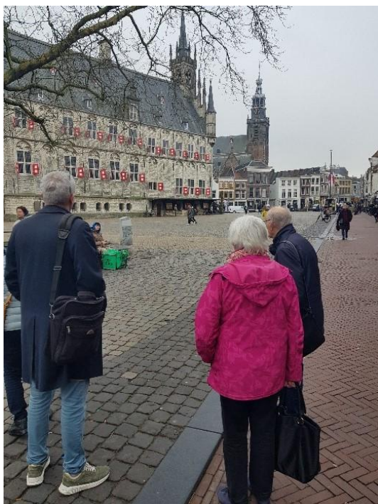
Gouda, Grote Markt, stadhuis en St. Janskerk en een aantal Schagenezen